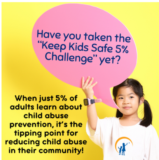
5% Desafío #1