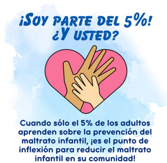
5% Desafío #2