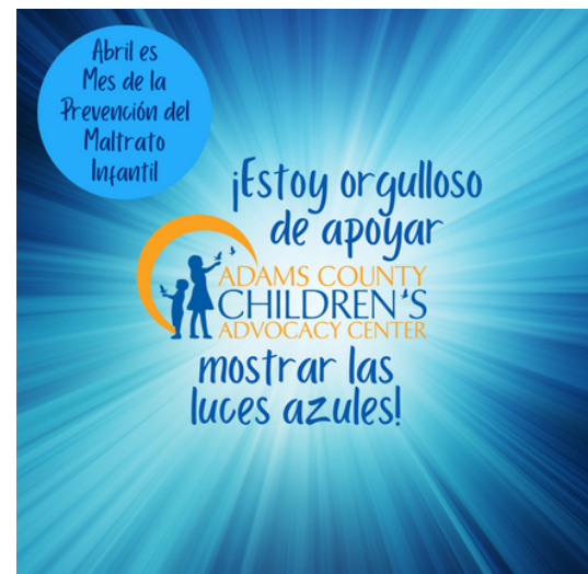
Mostrar las Luces Azules