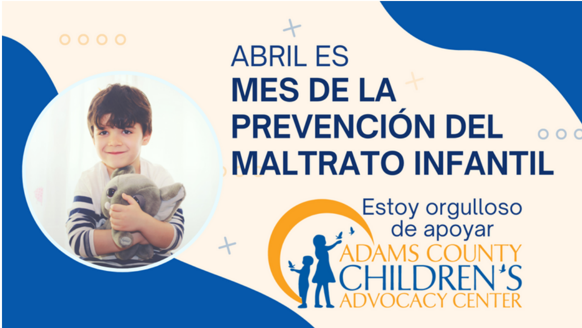
Portada de Facebook

Recuerde etiquetar @kidsagaincac y utilizar hashtags: #ChildAbusePreventionMonth #BrighterTomorrowsCAC