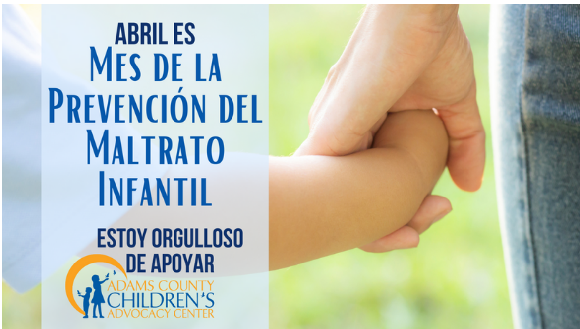
Portada de Facebook